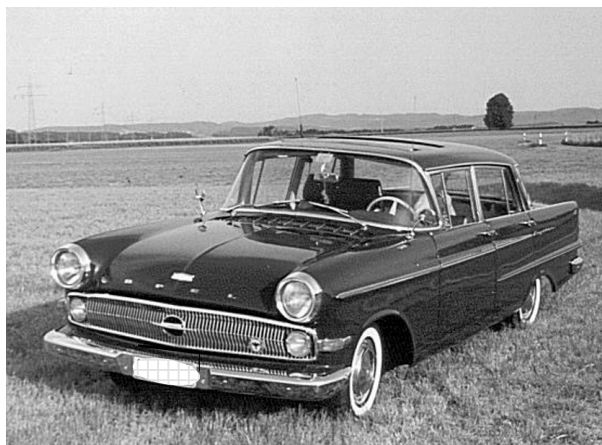
En sådan fast grå.

Nu skulle de besikta bilen och fast jag visade papper på att den var nybesiktad och godkänd gick de till verket med en skrämmande iver. De