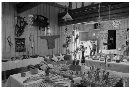
Utställning på Hembygdsgården, s 17