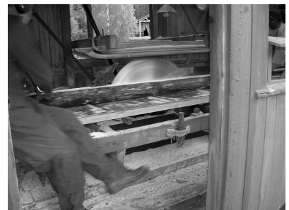
Lyredssågen, s 20