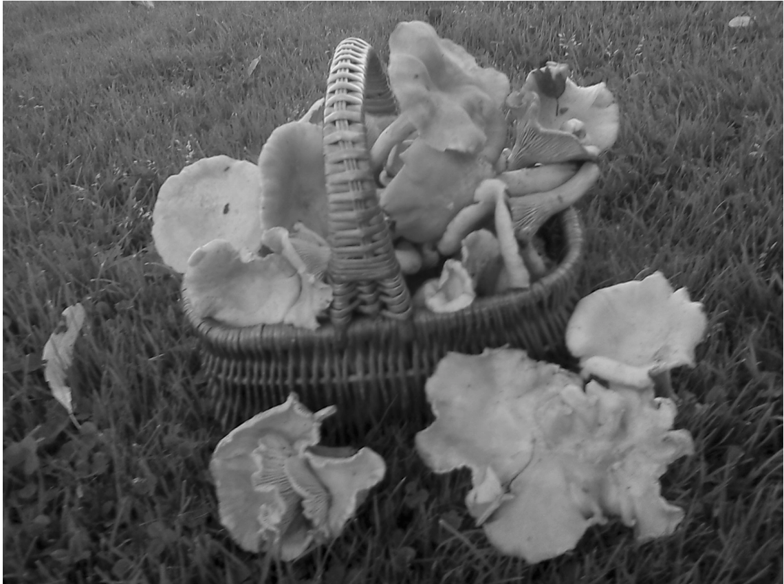
Recept på läckra svamprätter, s 19