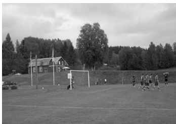
Fotbollsmatch, sid 7