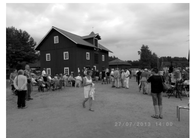
Sommarauktionen, sid 18