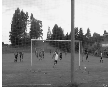
Älgå gör första målet.