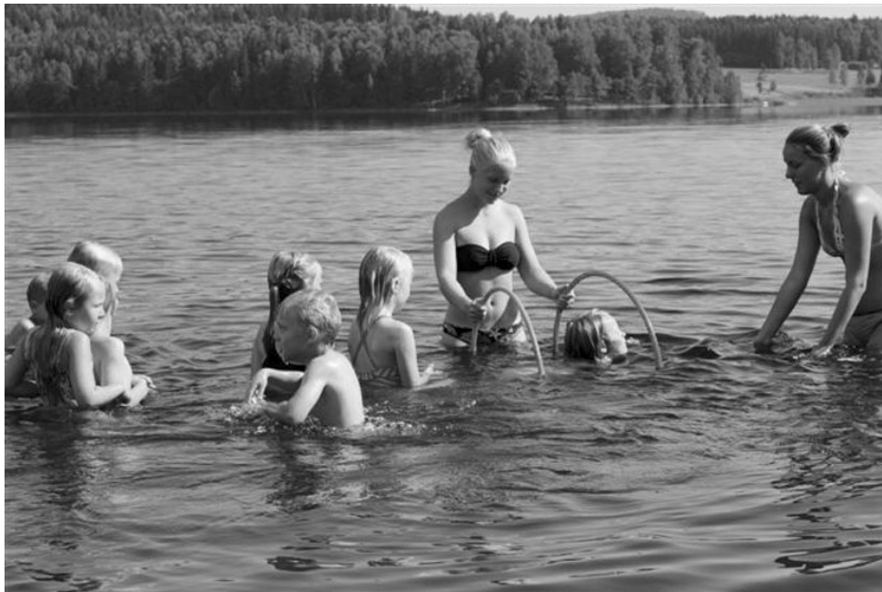
Årliga simskolan, sid 16-17.