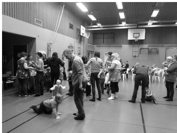
Full fart i gymnastiksalen.