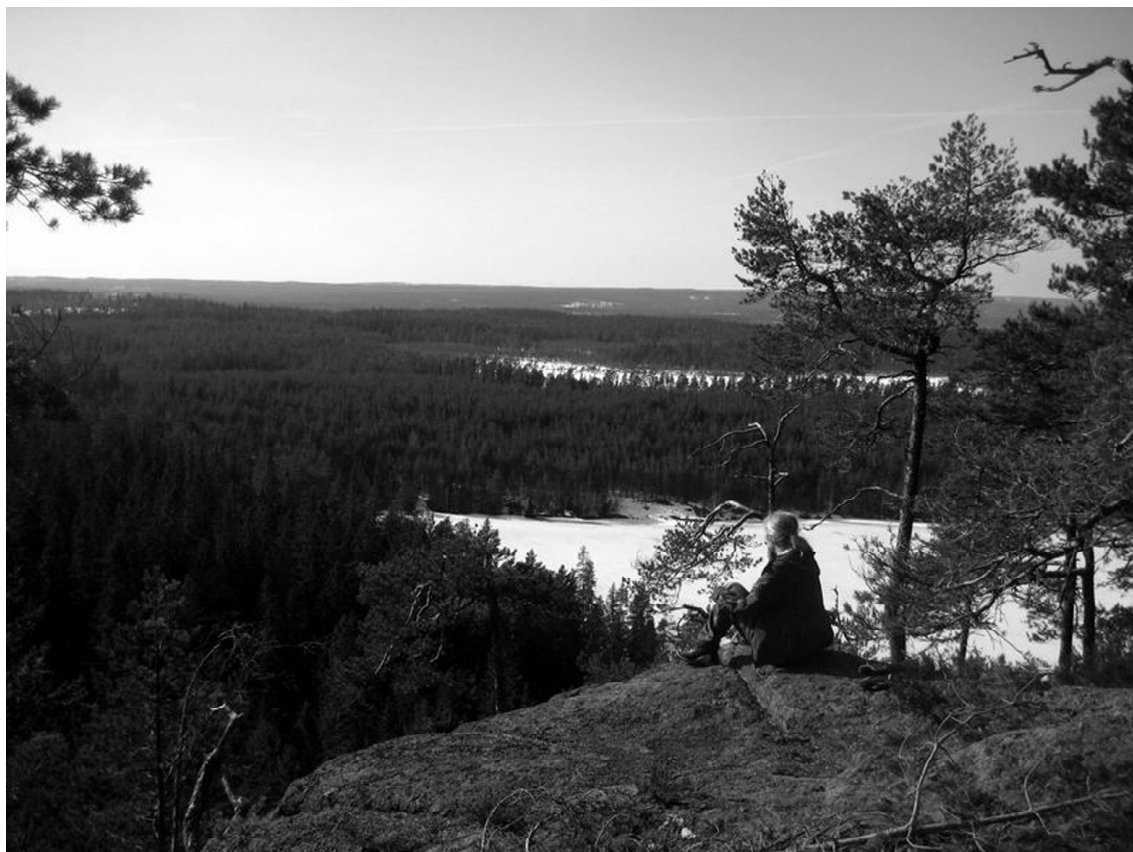
Äventyr i Gunnarskog, sidan 18