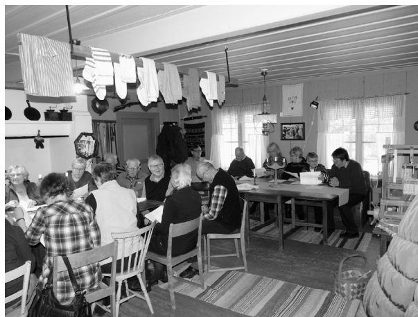
Günnerskinger bevarar dialektord för att kommande generationer ska kunna läsa och förstå riktigt fölkmål.

Första träffen var före jul med återträff i slutet av januari. Fortsättningsvis träffas gruppen varannan lördag framöver. Förhoppningsvis