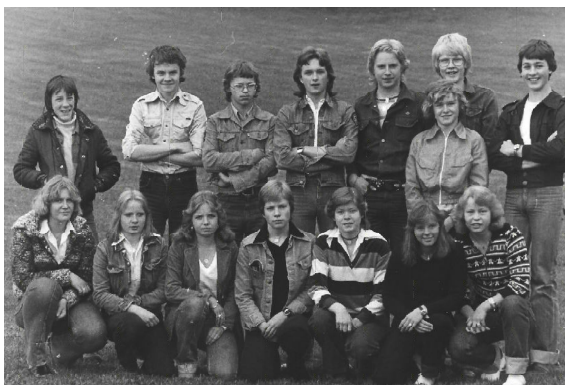
Födda 1962 i Järven fick de gå. Det var inte igår nu är de 50 år!