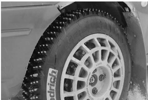
Vassa dubbar, och många!, behövs på en rallybil.

Det var stor publik både ute i skogarna och vid Power Stage-området, som också var serviceområde för bilarna och platsen för en servering för publik och förare. Ett väl genomfört evenemang där föreningen MK Team Treske, sponsorer och alla volontärer förtjänar ett stort tack!