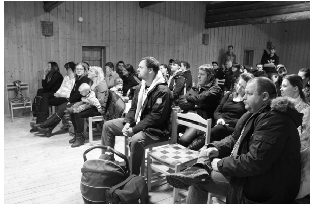
I väntan på förskoleplats.