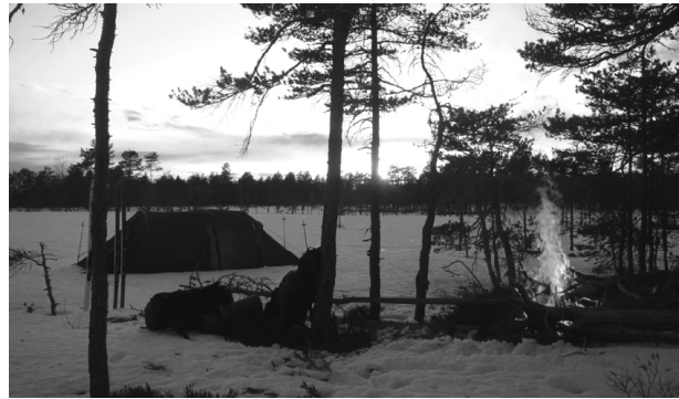
Tältplats i skogen

Förändringar i vårt levnadssätt har inneburit att vi blivit en stillasittande generation vilket kan innebära problem med vår fysik eftersom våra kroppar är byggda för rörelse. Ett aktivt friluftsliv