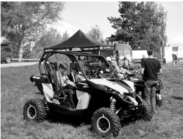
De här maskinerna är det nog många yngre som drömmer om att få äga.

Årets Günnerskemårten får läggas under epitetet ”vi hade i alla fall tur med vädret”, för veckorna i slutet av maj ja då regnade det i stort sett varje dag och vi som jobbade med mårten glodde på värderleksrapporter värre än i värsta ”slåttantid”. Men mårten kom och med solsken kom det också mycket folk. Jämt precis som ”för om åra” var varenda gata och öppen plats i Stommen omvandlad till parkeringsplats. Här följer lite mårtenbilder.