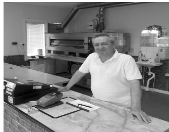
Pizzabagarn i Stommen, sid 4.