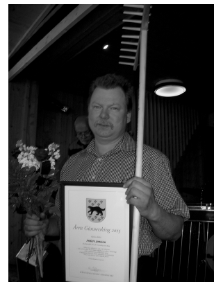
Årets Gånnersking, sid. 13.