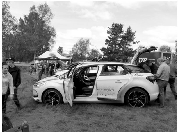
Folkliv runt om på demonstrationsfältet. En försäljare försöker kränga en fransk hybridbil.