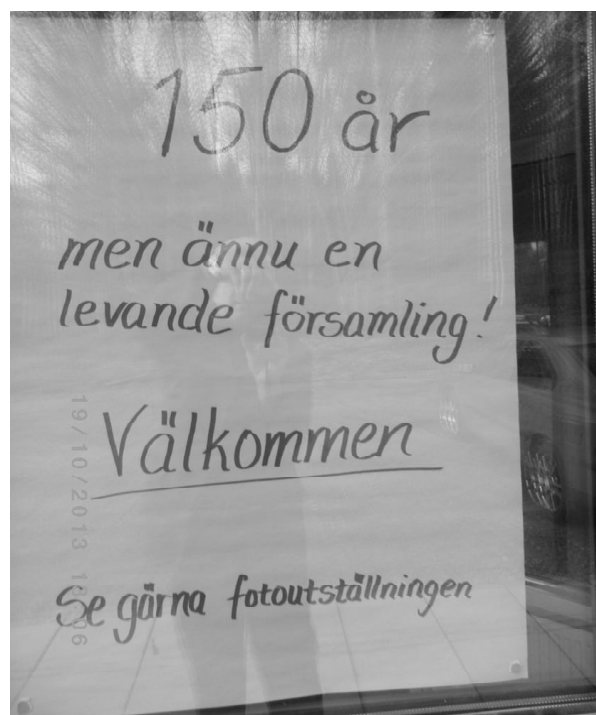
Denna affisch mötte besökarna vid dörren.

uppsats redovisat bl a medlemsutvecklingen mätt per 50-årsintervaller. Vid mätpunkten år 1913, dvs 50 år efter bildandet, uppgick medlemsantalet till 528 st. I början av 1900-talet kom en förnyelseväckelse från Norge in över gränstrakterna. I spåren av väckelsen som särskilt betonade andedopet får Missionsförsamlingen uppleva ett relativt stort medlemstapp till den sedermera, år 1924, bildade Betaniaförsamlingen. Ytterligare 50 år senare 1963 har medlemsantalet i Missionsförsamlingen halverats. Sett till andelen av totalbefolkningen har dock medlemsantalet stått bi sedan 1960-talet och utgör idag ca 100 medlemmar. 2011 gick Betaniaförsamlingen upp i Missionsförsamlingen efter att under några år delat pastor.