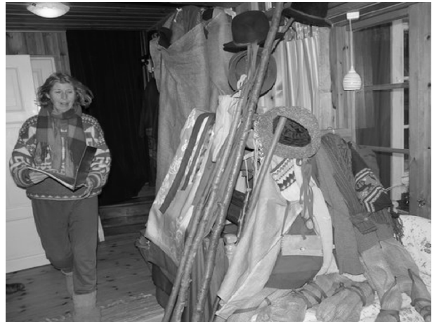
Ria med rekvisitapärmen