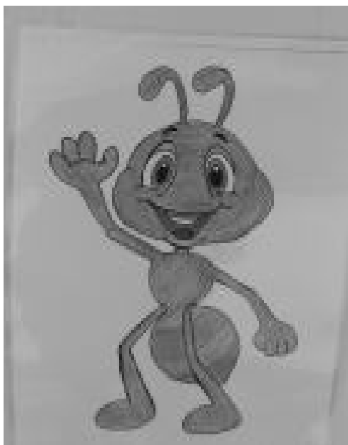
Svartmyran hälsar välkommen

Inte mindre än totalt 87 barn (1-5 år) går i förskolan fn och nästa stora årskull trycker på för att komma in. Det här är mycket positiva signaler för framtida elevunderlag för