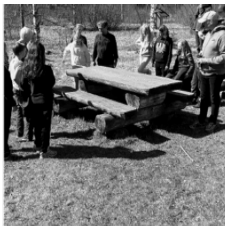
och aktiviteter utomhus