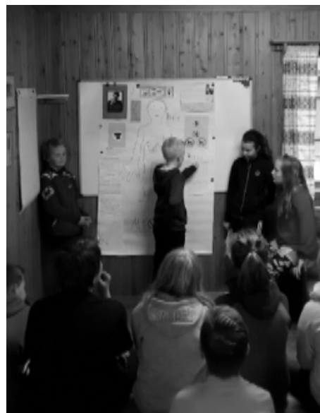
Lektioner inomhus ...