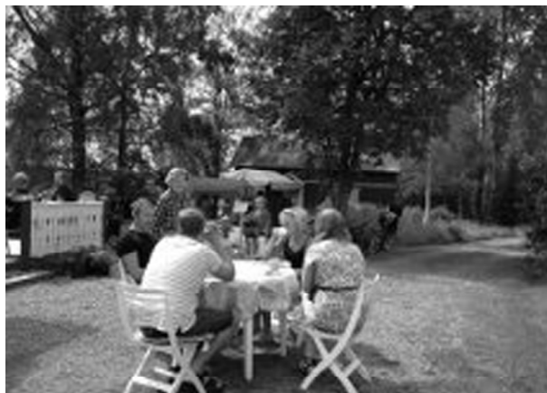
I parken utanför bygdegården har man det mysigt

Detta i kombination med ett bra husband med Ove Walter som musikalisk ledare, gästartister med stor bredd, liveillustrerat musikkryss, roliga historier och gästerna sittande vid cafébord samt (inte minst viktigt), låga priser på entré och servering gjorde att Fredros-caféerna fick en grundmurad popularitet – och kunde locka publik från ett mycket större område. Gästantalet steg också ganska snabbt till mer än vad som lokalen kunde inrymma. Man gjorde då en utbyggnad med en inglasad sommarveranda som gav sittplats för ytterligare 50 – 60 gäster.