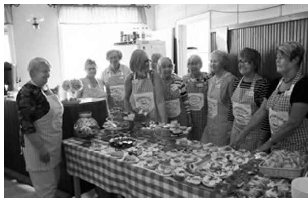
Panterdamer i bygdegårdens kök

Text och foto: Sune Johansson, ordf. i Fredros bygdegårdsförening.