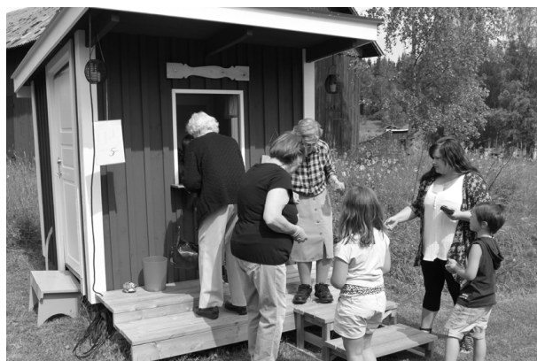
Här serveras kaffe och läsk