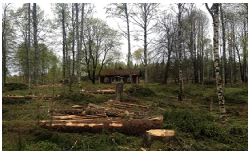
Med skog och ekonomi i åtanke

Besök oss gärna på vårt kontor, Maskingränd 1, Mosseberg Arvika. Vi ser fram emot att få träffa dig och bjuder givetvis på kaffe.