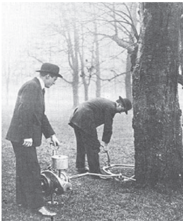
Förevisning av trädfällning med Sector. Foto från Djurgården 1917.

Stig ska nu försöka väcka liv i Sector men frågan är var han ska hitta reservdelar till den! Sector anses vara världens första kedjemotorsåg. Totalt tillverkade ca 600 Sector mellan 1916-1928. Ca 50 av dessa hamnade i Sverige.