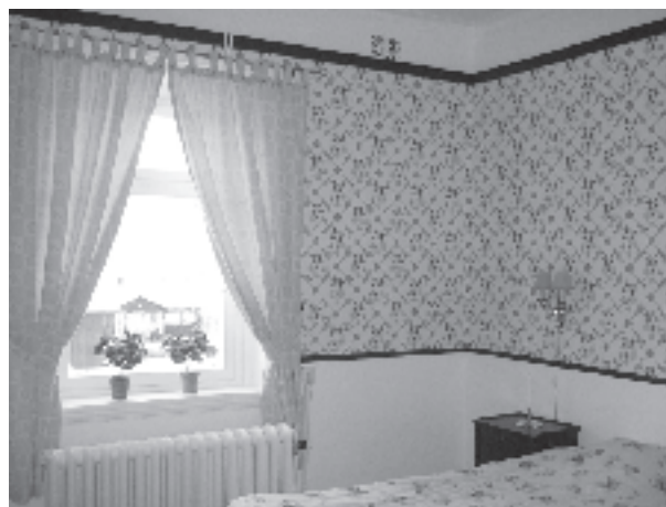
Nyrenoverat rum på vandrarhemmet.