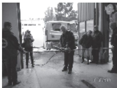
Räddningstjänsten, sid 8