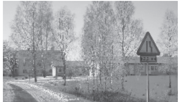
Öster om Larstomta finns ett varningsmärke för avsmalnande väg.

Att värna inte minst skolbarnens skolväg har varit ledstjärnan för de nu vidtagna åtgärderna. Att få till stånd en riktig, anständig, nydragen genomfartsled förbi Stommen verkar tyvärr vara utsiktslöst!