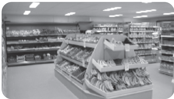
Nya generösa utrymmen i Thybergs lanthandel

Thybergs filosofi är att satsningen inte nödvändigtvis behöver resultera i stora omsättningsökningar varje år utan innebär att man säkrar framtiden med en kundkrets som återkommer. Byggkalkylen närmar sig 1,5 miljoner och satsningen som sån är ett bevis på att ägarna tror på en framtid i Gunnarskog.